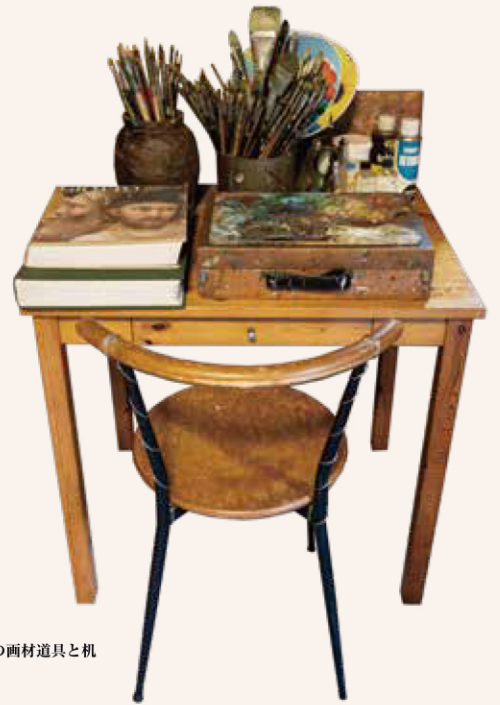
愛用の画材道具と机